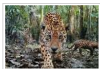
Tema: Truede dyr