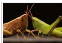
National Geographics fotoreportager