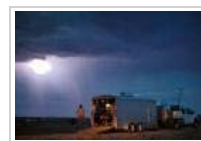
Sådan slår lynet ned