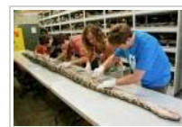
Video: Rekordstor pytonslange fanget