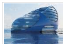
Fremtidens flydende byer